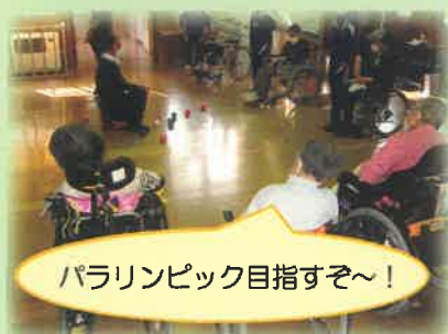
パラリンピック目指すぞ～!

オリエンテーションで施設内を見学した後、折り紙やまちがいを探しながら、実際に利用者様と接していただきました。カラオケや昼食の介助も、優しく丁寧に、とっても上手でした！2日目には、パラリンピックの競技にもなった「ボッチャ」で利用者様と対戦♪ベテランは強し!!