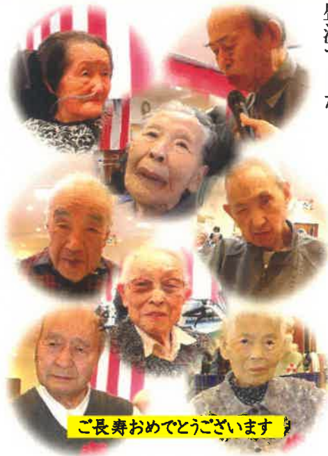
ご長寿おめでとうございます

昼食は赤飯、いちご煮風お吸い物、お刺身、天ぷら、茶碗蒸し、季節の果物など、とても華やかなお膳でした。 「豪華だなあ〜」 「美味しかった。」 お腹いっぱい！ と笑顔で召し上がっていました。