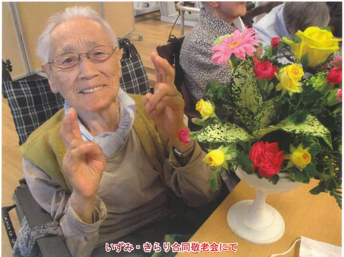
いずみ・きらり合同敬老会にて

誌名の由来：法人名を天台寺御本尊「桂泉観音」より頂戴した事にちなみ、「桂」の訓読み「かつら」を誌名と致しております。