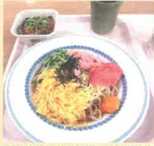
太陽荘産のミニトマト、茄子、ピーマンを使用!

さっそく厨房で調理され、季節のメニューとして利用者様に召し上がって頂きました!♪