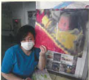
私だとわかりますか?