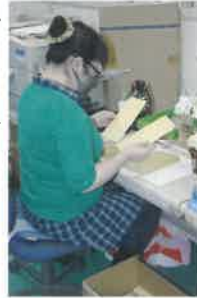
封筒の検品中 汚れはないかな