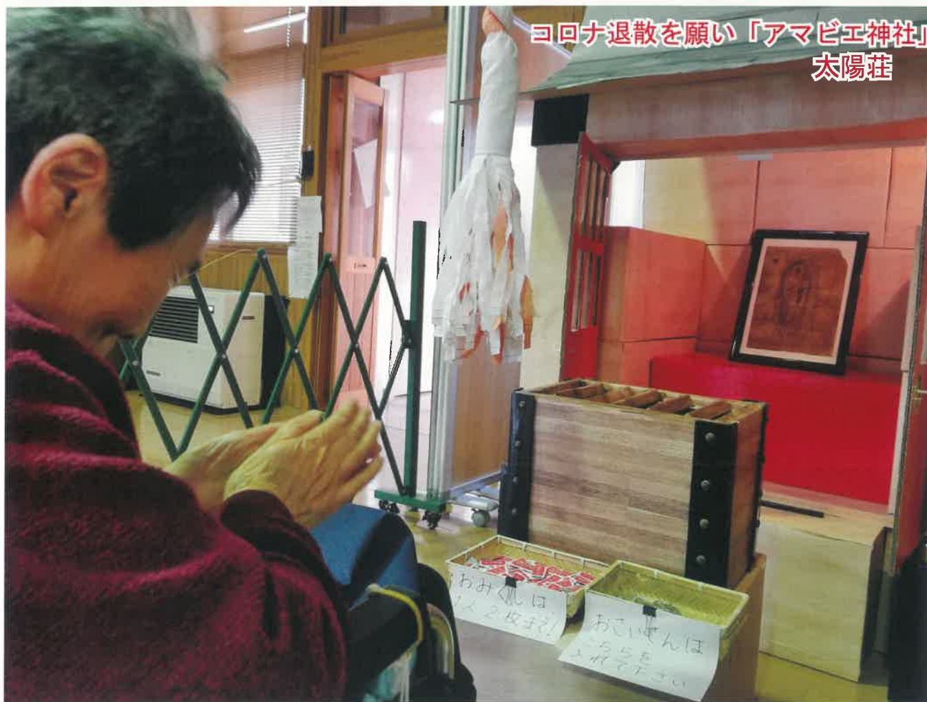
コロナ退散を願い「アマビエ神社」 太陽荘

誌名の由来：法人名を天台寺御本尊「桂泉観音」より頂戴した事にちなみ、「桂」の訓読み「かつら」を誌名と致しております。