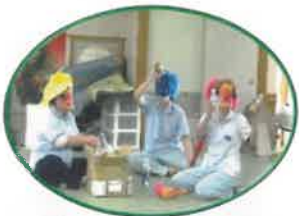
本物の鬼より怖い鬼！

鬼退治の場面では、利用者様も一緒にスポンジボールを投げて参加する方や「かわいそう」と鬼役の職員をかばって撫でてくださる利用者様もあり、楽しんで頂きました。