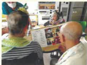
この写真は誰だと思う(…?)

新型コロナウイルスの影響もあり、例年とは違ったクリスマス会になりましたが、食事や余興に参加された利用者様、職員ともに楽しい会にする事が出来ました。