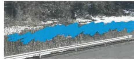
↑こんな感じで凍りました

みやびの食堂から馬淵川が見えます。今年は、例年以上の寒さが続き、完全凍結とはいきませんでした。1月8日、9日、11日に最低気温がマイナス15・8℃を記録しました。(10日もマイナス14・8℃でした。) マイナス15℃は別世界の寒さでした。