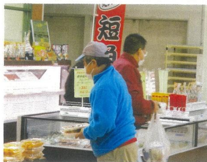
バスハイク（買い物）